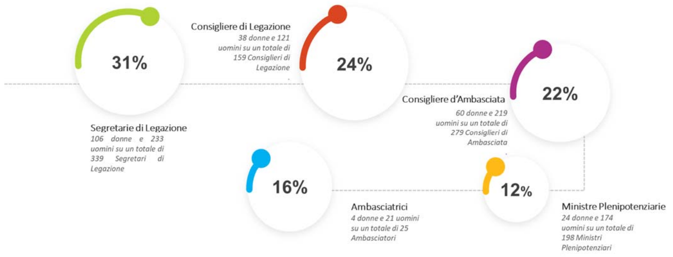
Figura 2: Rappresentanza per genere per ciascun grado della carriera diplomatica

Sempre nel 2019 nei gradi apicali della carriera diplomatica sono solo 4 le donne ambasciatrici di grado, 24 le Ministre Plenipotenziarie, 60 le Consigliere di Ambasciata, 38 le Consigliere di Legazione e 106 le Segretarie di Legazione, per un totale di 232 donne su 1.000 Diplomatici nel complesso.